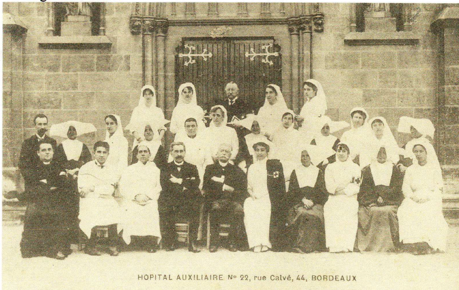
HOPITAL AUXILIAIRE N° 22, rue Calvé, 44, BORDEAUX

Président d'honneur du syndicat des vins et spiritueux il devait à ce titre recevoir la Légion d'Honneur. Au cours de la guerre 1914-1918 il a créé et administré rue Calvé un hôpital auxiliaire. Il était aussi Chevalier de St Grégoire le Grand