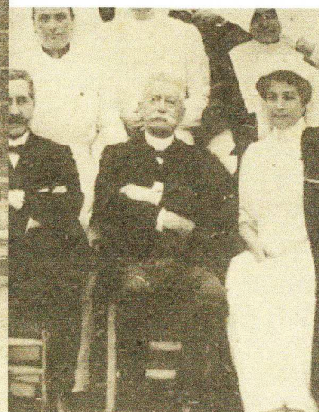
Carte postale de l'hôpital fondé par E. Glotin durant la guerre 14-18 situé au 22 rue Calvé à Bordeaux