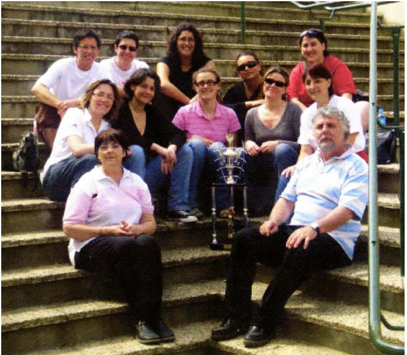
NBA savourant le trophée fédéral du Fair Play du 110° anniversaire de la FSCF

FSCF COMITE DEPARTEMENTAL DE LA GIRONDE – 145 rue de St Genès- 33082 BORDEAUX CEDEX E.Mail : fscf.cd33@free.fr Site Internet : http://fscfgironde.free.fr Tél/fax : 05 56 96 06 60