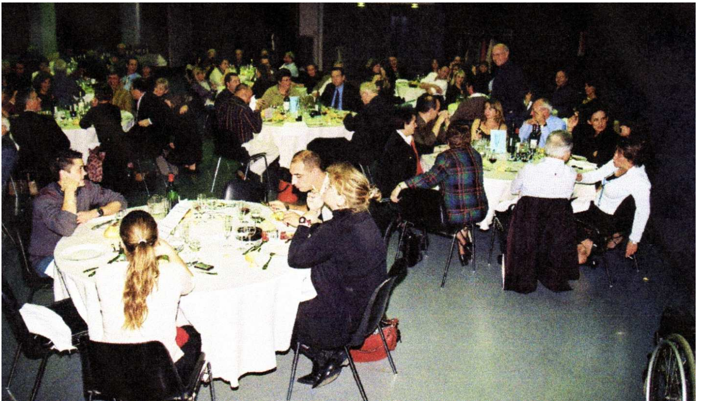
REPAS SPECTACLE DU 1 er décembre 2007