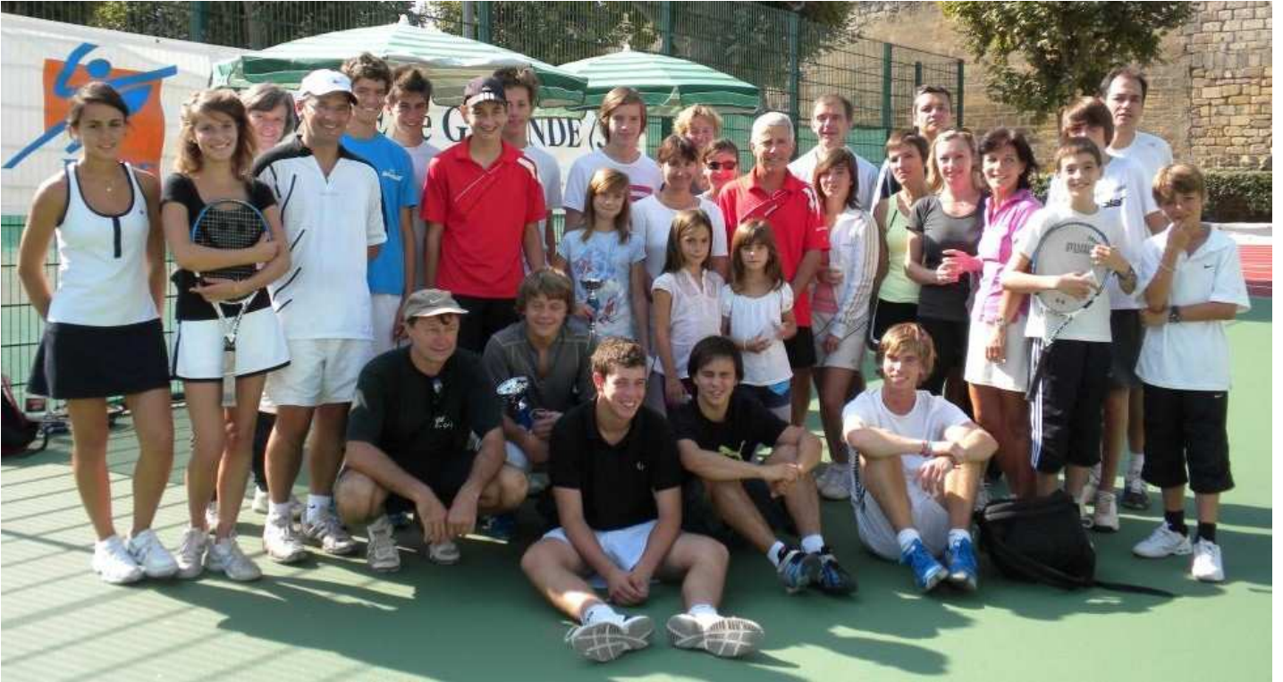
Les participants à la journée du 27 septembre 2009